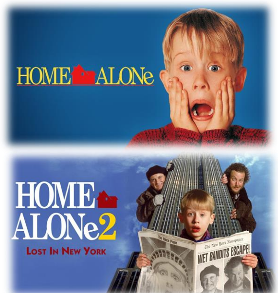
Filmski klasiki: Home alone 1 in 2

Vsekakor ne bo šlo brez Kevina McCallisterja, v večni klasiki Sam doma – verjetno nas je veliko takšnih, ki se tega filma preprosto ne naveličamo.