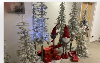
Praznično vzdušje v šolski avli