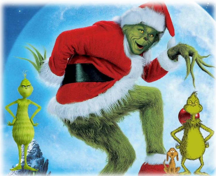
Eden in edini - Grinch

Božični čas je popoln za druženje ob vročem čaju, svečkah in prijetnem vzdušju, zato ne preseneča, da nas pozitivna čustva še bolj navdajo in opomnijo na pomen družine, prijateljstva in ljubezni. Le-tega so se in se še naprej zavedajo ustvarjalci filmskih klasik, ki vam jih predstavljam v nadaljevanju. Božiča brez njih, pač preprosto ni.