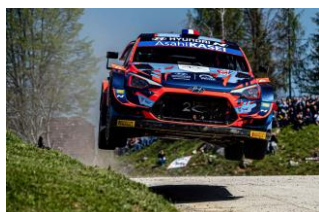
Moj najljubši hobi - reli