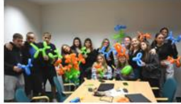
Kamp digitalnega marketinga