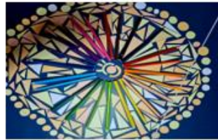
Art kamp v hotelu Tisa na Pohorju