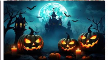
Predlogi filmov za Halloween