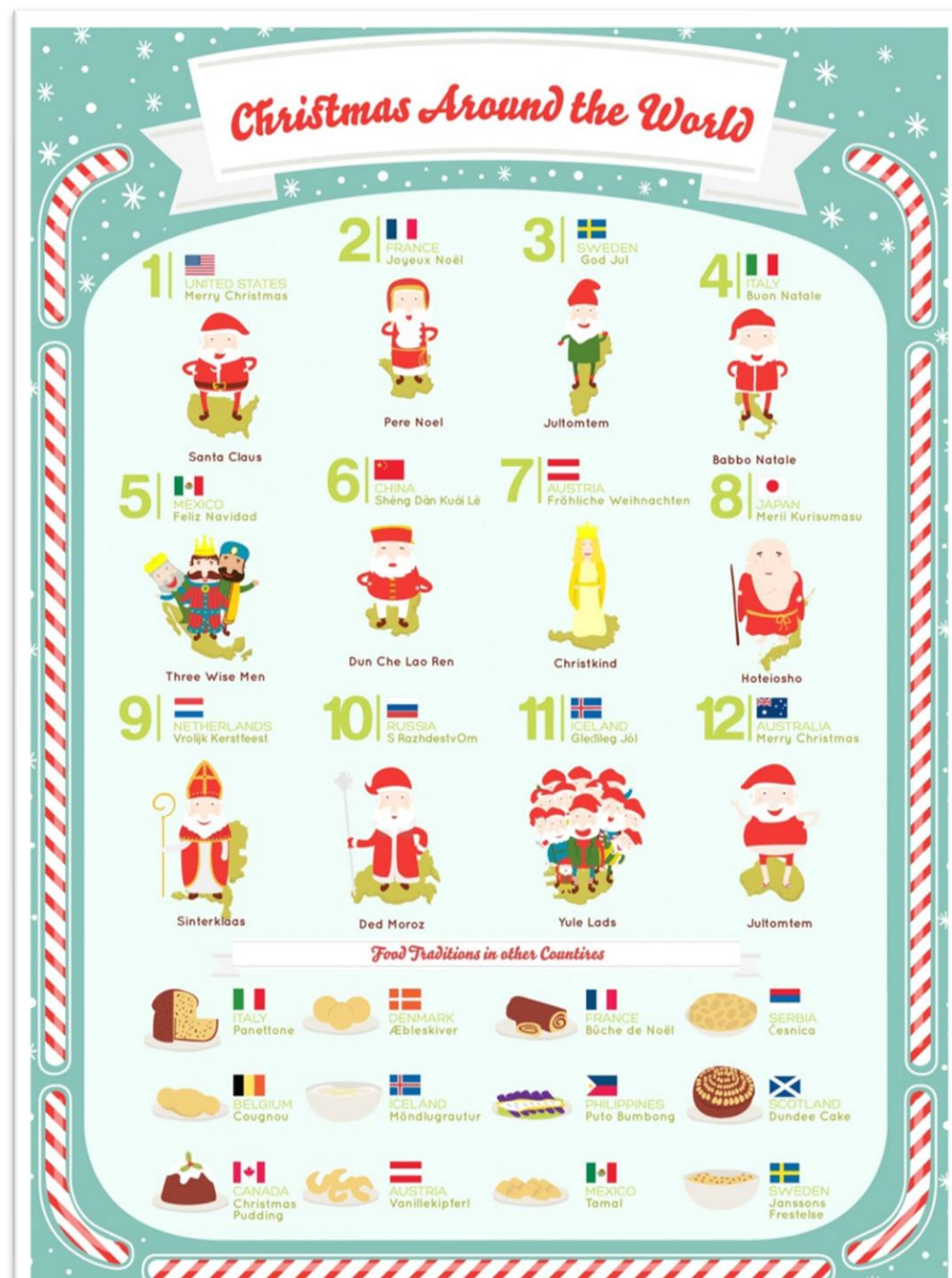
Na fotografiji: voščilo v različnih državah po svetu, poimenovanje dobrega moža in tradicionalna božična jed