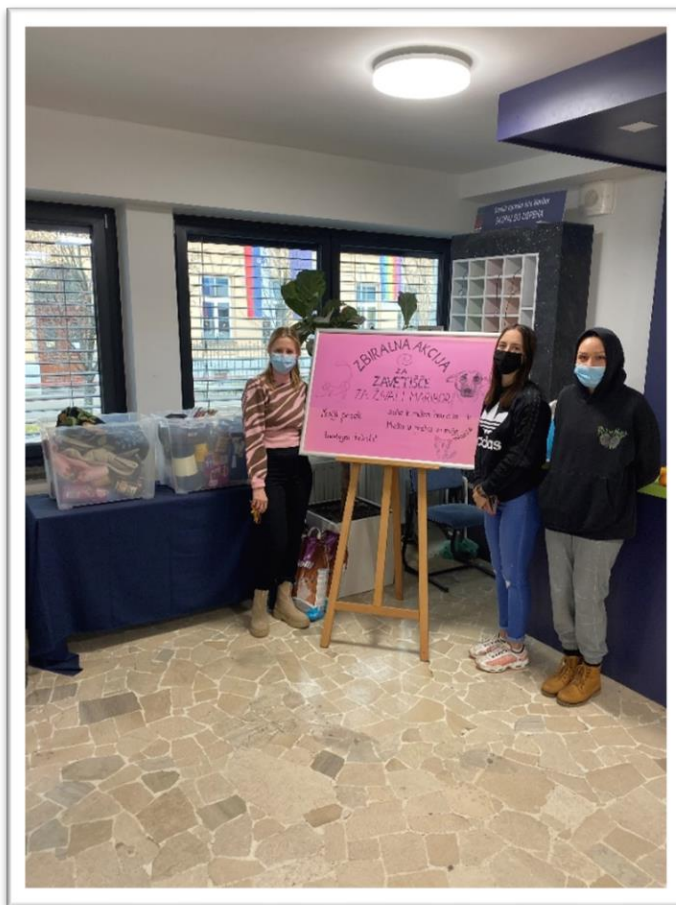
Na fotografiji: prvi dan zbiralne akcije