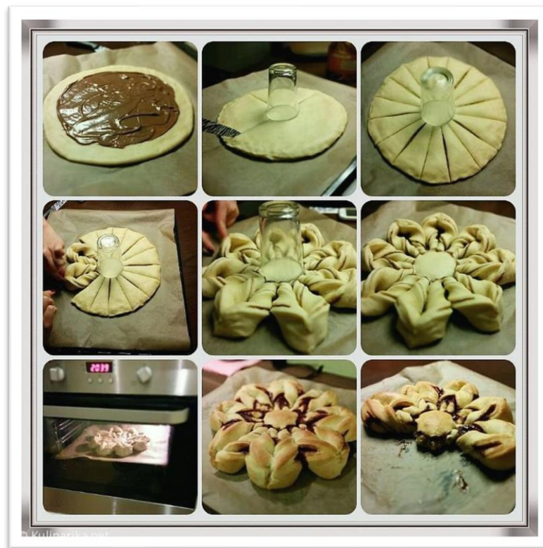
Na fotografiji: postopek izdelave nuteline božične zvezde