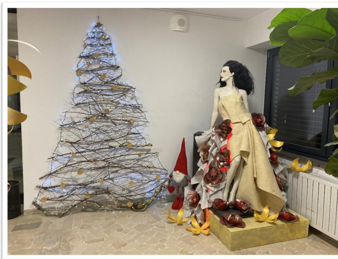
Na fotografiji: praznično vzdušje v šolski avli