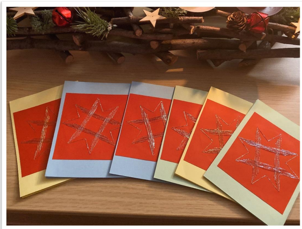
Na fotografiji: končni izgled voščilnic, narejenih po pick-point tehniki

Na kos stiroporja namestiš karton in nanj položiš šablono. Vzameš iglo in z njo naluknjaš šablono tako, da gre tudi skozi karton – tako nastane na kartonu oblika (luknjice), skozi katere bo nato potekal sukanec. Potem sukanec napelješ v iglo, ga na hrbtni strani kartona zalepiš in ga napelješ skozi luknjice kartona.