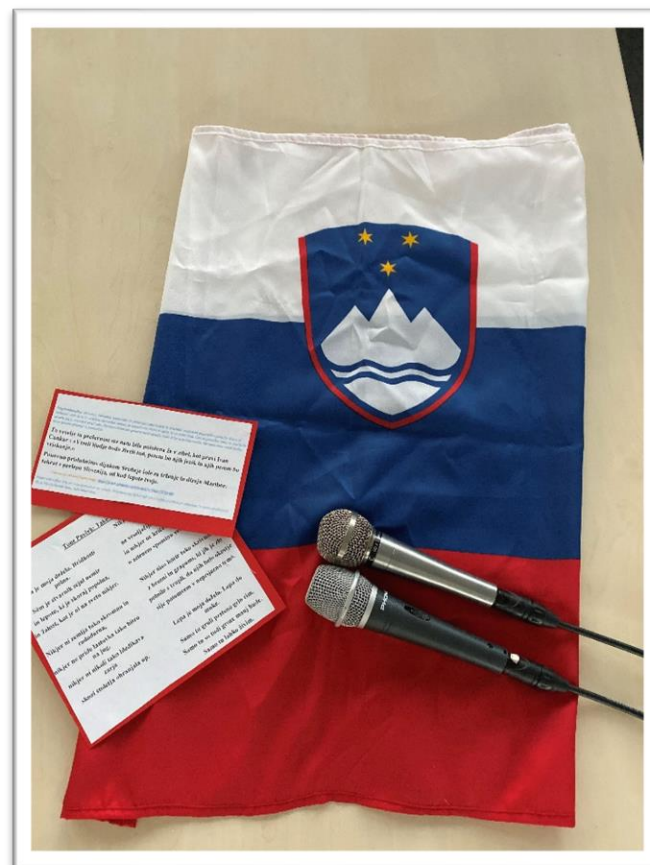
Na fotografiji: priprave na proslavo v polnem teku