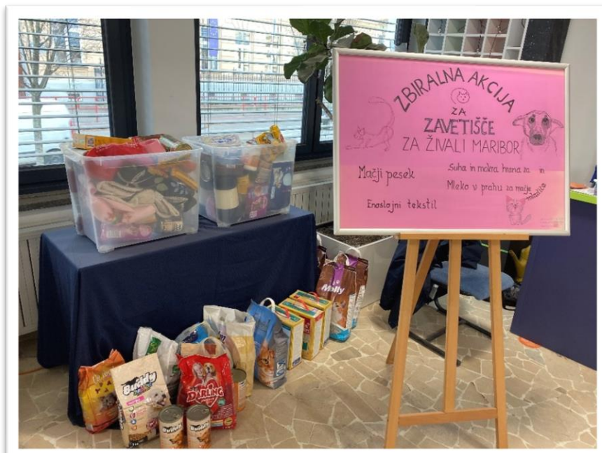
Na fotografiji: drugi dan zbiralne akcije